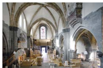
Die Bauarbeiten im Innern der Kathedrale

Über die vergangenen Jahrhunderte hinweg wurde die Kathedrale in Chur immer wieder umgebaut und restauriert. Während der laufenden Restauration wurden vor allem Gebäudemängel und Ursachen für die Schäden an der Innenausstattung behoben. Die technischen Einrichtungen der Kathedrale wurden ebenfalls erneuert. Die Bauherrschaft setzte auch ästhetische Verbesserungen im Innern der Kathedrale um. Die Herausforderung für das ausführende Architektenteam war, Lösungen zu finden, die den heutigen Standards entsprechen, aber den ursprünglichen Charakter der Kathedrale nicht beeinträchtigen.