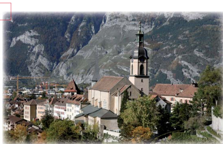
Ostansicht der Kathedrale St. Mariä Himmelfahrt in Chur

Aufgrund der gestiegenen Komfortansprüche wurde in der Kathedrale bereits 1937 eine Wärmeluftheizung eingerichtet. Dieses Heizsystem ist noch heute eine gute und effiziente Lösung. Um die Bausubstanz aufgrund der Temperaturwechsel zu schützen, wurde das Kathedralengewölbe vor Jahren mit Mineralwolle isoliert. Diese wurde im Rahmen der laufenden Restauration überprüft. Aufgrund vieler Fehlstellen und Verunreinigungen durch Schmutz und Bauschutt musste die vorhandene Isolation jedoch entfernt werden.