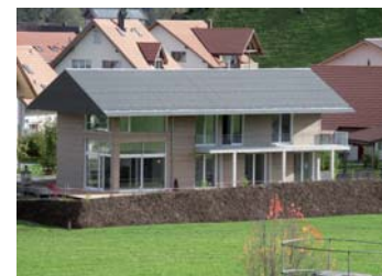
Einfamilienhaus der Kühni AG (Jörg + Sturm Architekten AG)

Die Zimmerei Kühni AG engagiert sich für ökologisches Handeln. Für ihre Isolationen verwendet sie deshalb ökologische Materialien wie isofloc-Zellulosefasern. Ausserdem dient ein Sammel silo für Holzabfälle der Produktion von Energie zur Speisung des Wärmeverbundes der Zimmerei Kühni AG und der angrenzenden Gärtnerei.