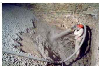
isofloc wird gleichmässig aufgesprüht

Die Entfernung der bestehenden Dämmung war auch notwendig, damit Statiker die Gewölbedecke begutachten und Elektriker die neuen Elektroinstallationen verlegen konnten. Mittels eines leistungsfähigen Absaugschlauches konnten die Mineralwolle und der Bauschutt mit relativ kleinem Aufwand und unter geringer Staubentwicklung abgesaugt werden. Eine erneute Dämmung des gemauerten Deckengewölbes bot sich danach aus verschiedenen Gründen an.