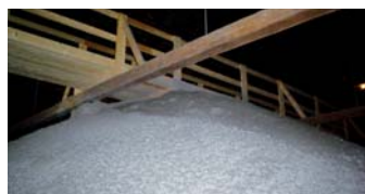
Gleichmässige isofloc-Dämmschicht

isofloc wird direkt auf die gereinigten Gewölbeflächen gesprüht. Durch die massvolle Wassergabe beim Aufsprühen entsteht eine kompakte Dämmschicht. Dank dieser Strukturänderung müssen keine Massnahmen gegen das Abrutschen ergriffen werden, und die Zellulosefasern werden nicht von der Zugluft weggetragen.