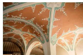
Reich verzierte Gewölbedecken in der Krypta der Kathedrale

Der Warmluftstrom der Heizung zirkuliert nur im Hauptschiff. Deshalb wurde auf eine Dämmung der Seitenschiffe verzichtet. Im Januar 2007 wurde das Gewölbe des Hauptschiffes im Kompaktsprayverfahren mit einer isofloc-Dämmschicht von 15 cm isoliert. Die Bauherrschaft hat sich für isofloc entschieden, da es im Vergleich zu Platten einfacher und kostengünstiger eingebaut werden kann. Die Sorptionsfähigkeit von Zellulosefasern war ein weiterer ausschlaggebender Faktor.