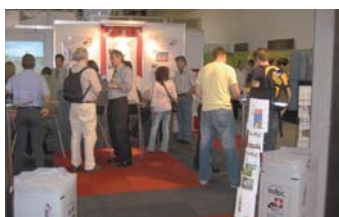
Der Messeauftritt an der Bauen & Modernisieren 2006

Vom 30. August bis 3. September öffnet die Messe Bauen & Modernisieren in Zürich ihre Tore. Wir freuen uns, Sie am isofloc-Stand begrüßen zu können. Dieses Jahr finden Sie uns an der Sonderschau MINERGIE, die unter dem Thema „MINERGIE – Modernisieren mit Weitblick“ steht.