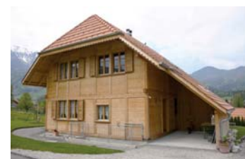
Das Kühni-Haus gibt es in verschiedenen Ausführungen

Holz ist nicht nur Baustoff, Holz ist Trägermaterial, Trennwand, Boden, Decke, Isolation und Verkleidung in einem. Deshalb baut die Zimmerei Kühni AG mit Holz, und das seit über 15 Jahren. Sie setzt sich konsequent für die Verwendung von Holz in allen Bereichen ein. Weit herum bekannt ist die Zimmerei Kühni AG für ihr Kühni-Haus, das in verschiedenen Ausführungen erhältlich ist. Das Kühni-Haus wurde bereits über 30 Mal gebaut und ist immer mit isofloc-Zellulosefasern gedämmt.