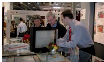
Die isofloc AG an der Sonderschau MINERGIE (Immo-Messe)

Wer heute nach MINERGIE oder nach dem strengeren Standard MINERGIE-P baut oder modernisiert, gehört zu den Schrittmachern in der Baubranche. Dass ein minimaler Energieverbrauch bei gleichzeitig maximalem Komfort technisch möglich und bezahlbar ist, zeigen die über 7000 in der Schweiz zertifizierten MINERGIE-Gebäude respektive die rund 130 nach MINERGIE-P zertifizierten Bauten. Dabei wird der tiefe Energieverbrauch durch konsequentes Ausnutzen der solaren Wärmegewinne, eine sehr gute Wärmedämmung, eine dichte Gebäudehülle und durch Minimieren der Wärmebrücken erreicht.