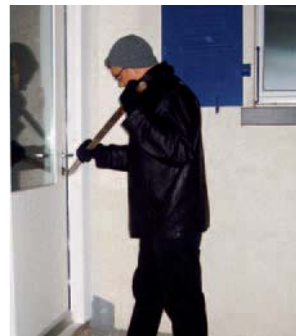
Gesicherte Türen, Fenster und Lichtschächte können einen Einbruch stark erschweren oder gar verhindern.

haben Einbrecher oft leichtes Spiel. Mit mehr oder weniger Kosten und Aufwand werden Türen und Fenster sicherer.