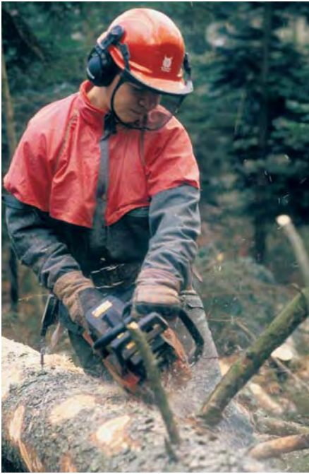
Der Profi schützt sich. Warum nicht auch der Hobbygärtner?

gen- und Nasenschleimhäute sowie die Atemwege. Da die Ozonkonzentration zwischen 16 und 18 Uhr am höchsten ist, sollten körperliche Anstrengungen in dieser Zeit sowohl auf der Baustelle als auch in der Freizeit möglichst vermieden werden. In den frühen Morgenstunden dagegen ist die Konzentration niedrig. Also, lieber in der Frische des Morgens Joggen, Biken oder im Garten arbeiten. Und nicht nur im Sommer sollten Sie viel trinken; am besten alkoholfreie Getränke.