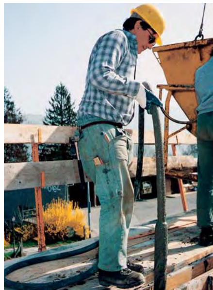
Der Helm ist auf den meisten Baustellen eine Selbstverständlichkeit. Immer mehr ist es auch der Schutz der Mitarbeitenden vor dem gefährlichen Feinstaub.

Seit September 2002 gilt die Baurichtlinie Luft. Sie verlangt, dass auf länger bestehenden Grossbaustellen mittlere und grosse dieselmotorbetriebene Baumaschinen mit Partikelfiltern ausgerüstet sein müssen. Das Fundament für eine Senkung der Feinstaubbelastung ist damit gelegt.