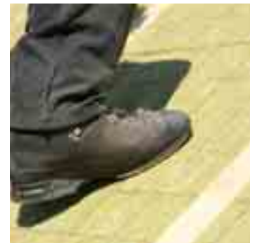
Trittfest und formstabil