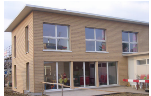
Einfamilienhaus Zehnder-Löffel, Niederlenz

Casa-Vita ist stolz darauf, diesem Qualitätsdenken ebenfalls nachzuleben. Das Einfamilienhaus Zehnder-Löffel in Niederlenz wurde der VGQ-Prüfung unterzogen und hat das Zertifikat anstandslos erhalten. Die Luftdichtigkeitsmessung hat sogar ein Resultat ergeben, das die höheren Minergie-P-Anforderungen erfüllen würde. Das freut das Team von Casa-Vita sehr und ist Ansporn, weiterhin Leistungen in perfekter Qualität zu bieten.