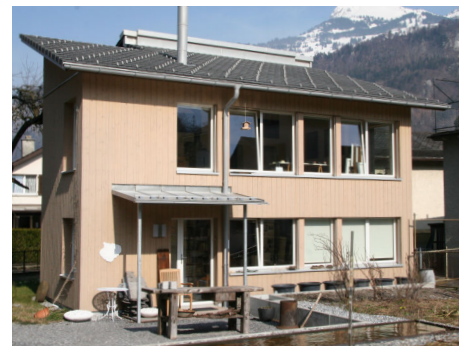
Atelier Lotte Müggler, Netstal